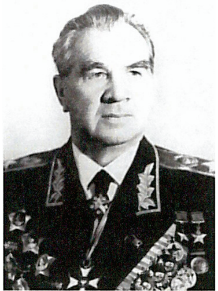
Маршал Советского Союза Чуйков В.И. Начальник гражданской обороны СССР с 1961 г. по 1972 г.

Рост разрушительной силы ракетно-ядерного оружия и неограниченные по дальности возможности его доставки к целям вызвали необходимость создания системы, которая бы обеспечивала надёжную защиту населения и народного хозяйства от оружия массового поражения в масштабе всей страны.