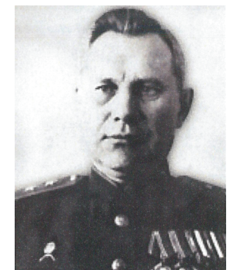
Генерал-лейтенант Королёв М.Ф. Начальник МПВО г. Москвы с августа 1942 г. до конца войны

За годы войны на тыловые объекты страны совершено 659 445 вражеских самолётных вылетов, в ходе которых сброшено около 600 тысяч фугасных и около 1 миллиона зажигательных авиабомб .