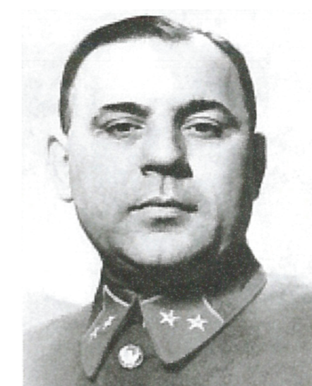
Комбриг Фролов С.Ф. Начальник МПВО г. Москвы с 1940 г. по 1942 г.